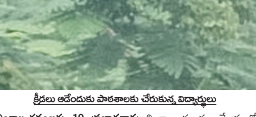
క్రీడలు ఆరంభించు పాఠశాలకు చేరుకున్న విద్యార్థులు