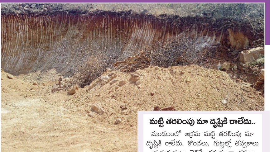
అనుమతుల్ని రెవెన్యూ అధికారులు కేటాయించిన కొండ గుట్టల్లో తవ్వకాలు చేపట్టాల్సి ఉంటుంది.

అడ్డుకోవాలి అధికారులు అటువైపు కనీసం కన్నెత్తి కూడా చూడకపోవడంతో వారి ఆగడాలు అడ్డు, అదుపు లేకుండా పోతుంది. దీంతో కోట్లాది రూపాయలను ఆక్రమ మార్గాన సంపాదిస్తున్నారు. మట్టి ఆక్రమ రవాణాకు సంబంధిత అధికారులకు భారీ స్థాయిలో ముడుపులు ఇస్తున్నారని పలువురు బహిరంగంగా ఆరోపిస్తున్నారు. మంగనూరు శివారులోని చేగుంట గేటు సమీపంలోని గుట్టను కొన్ని నెలలుగా ఎక్కవేలర్ సాయంతో తవ్వేస్తున్నారు. కర్నూల రిజర్వాయర్ వనరుల కోసం వేలాది టిప్పుడ మట్టిని ఆక్రమంగా తరలించడంతో ప్రభుత్వానికి లక్షలాది రూపాయల ఆదాయం గండిపడింది. ఆక్రమంగా మట్టిని తవ్వడం కాకుండా అమ్మకాల్లో కూడా ధరలు నిర్ణయిస్తున్నారు. గతంలో రూ. 500ల నుంచి రూ. 700ల ఉన్న ట్రాక్టర్ల మట్టి నేడు రూ. వెయ్యి నుంచి రూ. 1300ల వరకు అమ్ముతున్నారు. ఇలా నిత్యం ట్రాక్టర్లు, టిప్పుడ ద్వారా మట్టిని తరలిస్తున్నారు. మైనింగ్ అధికారులు