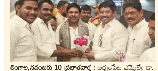
లింగాల, నవంబరు 10 ప్రభాతవార్త : అచ్చంపేట ఎమ్మెల్యే డా. చిరుగడ్డ వంశీకృష్ణకు సేవప