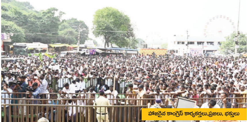
పాతజైన కార్గెస్ కార్యకర్తలు, ప్రజలు, భక్తులు