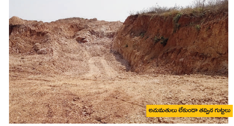
అనుమతులు లేకుండా తవ్విన గుట్టలు

చేతుల్లో కనుమరుగవుతున్నాయి. అనుమతులు లేకుండా దండం యథేచ్ఛగా సాగుతుంది. మండలంలోని కొండలు, గుట్టలు మట్టి మాఫియాతో కలిసిపోతున్నాయి. సహజ సంపదను కొల్లగొడుతూ సొమ్ము చేసుకుంటున్నారు. రెవెన్యూ, మైనింగ్ అధికారులు అటువైపు చూడకపోవడంతో అక్రమంగా మట్టిని తవ్వకొండ, గుట్టలను గుట్ట చేస్తున్నారు. అధికార పార్టీకి చెందిన నాయకుల పూటూను మట్టి మాఫియా చెలరేగిపోతుండడంతో మట్టి అక్రమ రవాణాకు అడ్డులేకుండా పోతోంది. సాధారణంగా చెరువుల, గుట్టల నుంచి మట్టిని తోలుకోవడానికి ప్రభుత్వ అనుమతితో ప్రభుత్వానికి రాయల్టీ (సినరేజి) చెల్లించాలి. ఇందులో ప్రభుత్వ వసూలు సంబంధించి కొంత మినహాయింపు -మగతా2లో..