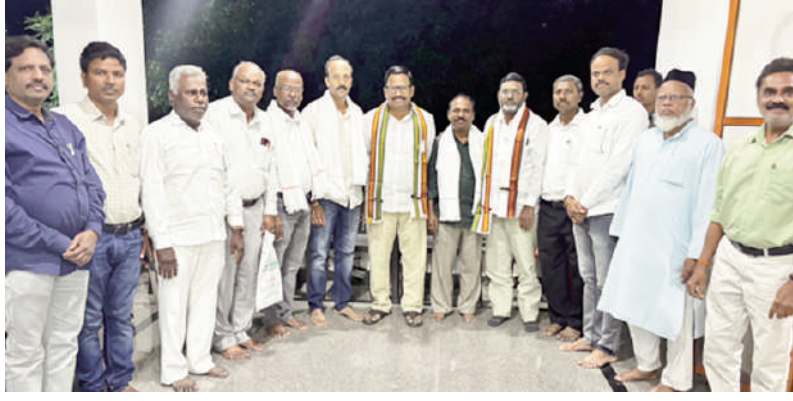
ఎమ్మెల్యే యెన్సం కలిసి గెజిటిడ్ హెచ్ఎం నూతన కార్యవర్గ సభ్యులు